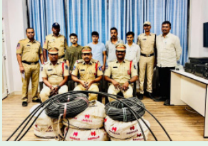
పాల్గొనినవి విధులలో వైల్లడనన్నారు.