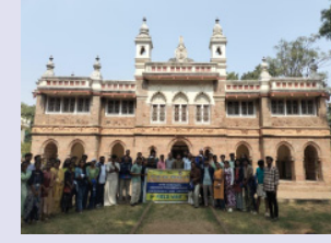
యల్.బి.ఆర్.సి.ఈ కళాశాల అసిస్టెంట్ యస్.యస్.యస్. యూనివర్సిటీ ఆఫ్ ఇంజనీరింగ్ అండ్ టెక్నాలజీ యువజన మార్మిడి కార్యక్రమం (అంబర్ - స్టేట్ యూత్ ఎక్స్పోజి ప్రోగ్రామ్) (03-02-2026 నుండి 07-02-2026) జరుగుతుంది.

విజయవాడ, భారత శక్తి ప్రతినిధి, ఫిబ్రవరి 6: కేంద్ర యువజన వ్యవహారాల మంత్రి మంత్రికృత శాఖ అధ్యక్షులతో నిర్వహించుచున్న మై భారత్ (మై భారత్) కార్యక్రమం భాగంగా లక్ష్మీ బారెట్టి ఇంజనీరింగ్ కళాశాల యస్.యస్.యస్. యూనివర్సిటీ ఆఫ్ ఇంజనీరింగ్ అండ్ టెక్నాలజీ యువజన మార్మిడి కార్యక్రమం (అంబర్ - స్టేట్ యూత్ ఎక్స్పోజి ప్రోగ్రామ్) (03-02-2026 నుండి 07-02-2026) జరుగుతుంది.