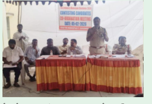
తీసుకోవాలన్నారు. ఏడై నవమూల ఉంటే దయలో 100 ద్వారా నిలబడనలను పాటించాలన్నారు. రాష్ట్రాలు, ఉత్తరగోల్కానులు చేసేవారు ముందస్తుగా పోటీనలను సుందీ అనుమతులు

రామవంధ్రపురం, భారత శక్తి ప్రతినిధి, ఫిబ్రవరి 6: రానున్న మున్సిపల్ ఎన్నికల సజావుగా నిర్వహించేందుకు సంబంధించి ఈరోజు ఇన్స్టాన్సర్లు, ఇంట్రీజర్లు మున్సిపాలిటీ కమిషన్ మున్సిపల్ కమిషనర్లు, రిటర్నింగ్ అధికారులు, ఎన్ఎస్ఐ, ఎన్ఎస్ఐ బృందాలు, అసిస్టెంట్ ఎలక్షన్ ఎగ్జిక్యూటివ్ అధికారులు, మాన్యుల్ ట్రైనర్లు, పోటీ చేస్తున్న అభ్యర్థులతో సమన్వయ సమావేశం నిర్వహించారు.