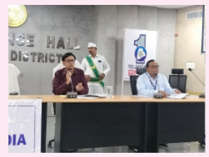
ఉమ్మడి ఆదిలాబాద్ జిల్లా బ్యారో, ఫిబ్రవరి 06 (భారత శక్తి) మున్సిపల్ ఎన్నికల నిర్వహణ ప్రక్రియలో సూక్ష్మ